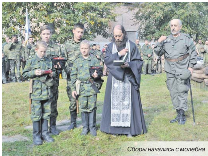
Сборы начались с молебна