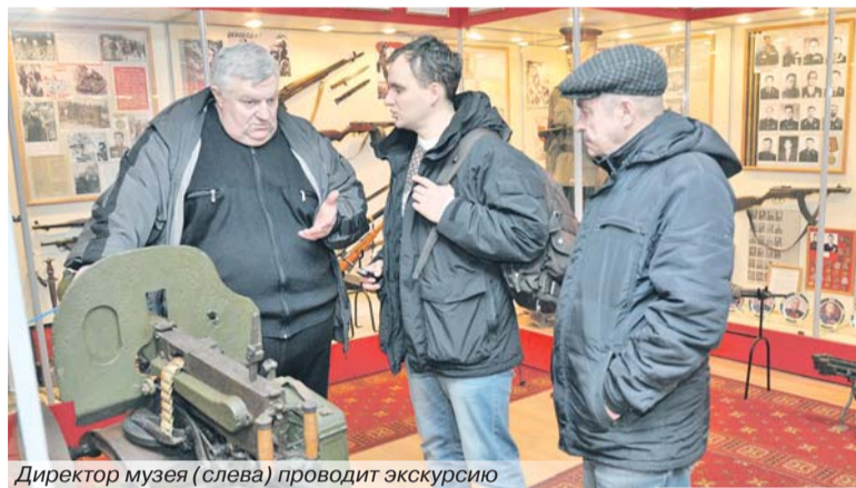
Директор музея (слева) проводит экскурсию

Подмосковная Руза - город особенный. Население здесь всего около 13 тысяч, и это единственный райцентр в Московской области, где нет железнодорожного сообщения со столицей. Зато имеется сразу три подразделения МВД России - городской отдел полиции, филиал Московского университета МВД России имени В.Я. Кикотя и Центр профессиональной подготовки сотрудников подмосковного ГИБДД. Так что Рузу по праву можно назвать «полицейской столицей» Подмосковья.