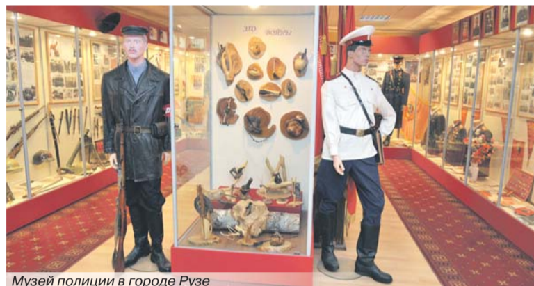
Музей полиции в городе Рузе

Отдельный раздел посвящён становлению советской милиции. Посетители могут увидеть настольную лампу бывшего на-